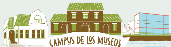
CAMPUS DE LOS MUSEOS