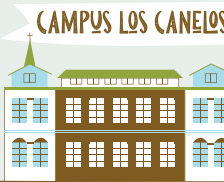
CAMPUS LOS CANELOS

El 18 de julio de 2007, bajo el decreto DE 1377, la Iglesia y el Convento de San Francisco de Valdivia fueron declarados Monumento Nacional en la categoría de Monumento Histórico. Su Convento es hoy el Centro de Extensión Campus Los Canelos, donde se concentran las unidades de Vinculación con el Medio, tales como los elencos artísticos, ediciones UACH y los programas de vinculación con el sistema escolar y productivo regional.