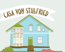
CASA VON STILLFRIED